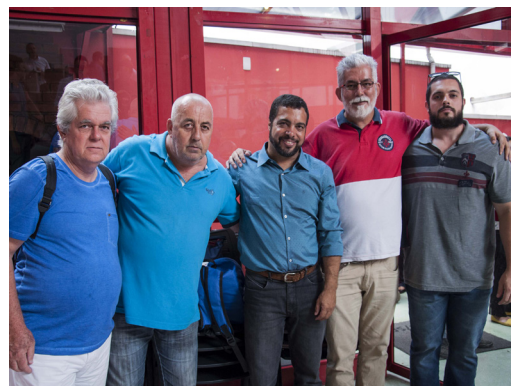
Participação do Presidente do SISEMUG na Terceira Feira da Reforma Agrária promovida pelo MST