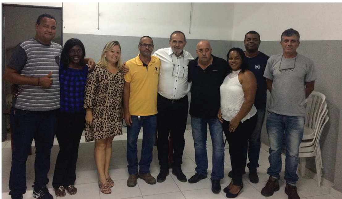
Visita do Presidente da Federação Estadual e Confederação Nacional dos Servidores Públicos Municipais e pré-candidato à Deputado Federal em Guaratinguetá

Os eventos do ano de 2018 começaram com uma importante plenária sobre a reforma da Previdência ministrada pelo ex-ministro da previdência Carlos Gabas, no dia 28 de Janeiro, que explicou como ficaria a situação do Brasil depois da reforma, como chegamos até ela e quais as consequências ela traria para os Sindicatos e aos trabalhadores. Foi importante para os Diretores Sindicais que participaram e também para os Servidores Municipais que ali estavam entender como poderiam se preparar para o que estaria por vir, tanto no dia a dia do trabalho de um Sindicato quanto financeiro, já que juntamente com essa reforma viria o fim da Contribuição Sindical que mantém os Sindicatos atuantes.