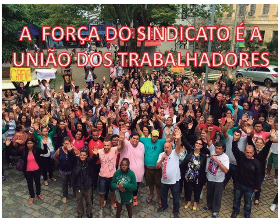
Primeira Greve dos Servidores Municipais de Guaratinguetá