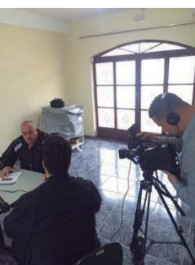
Gravação do Programa Presidente na Estrada