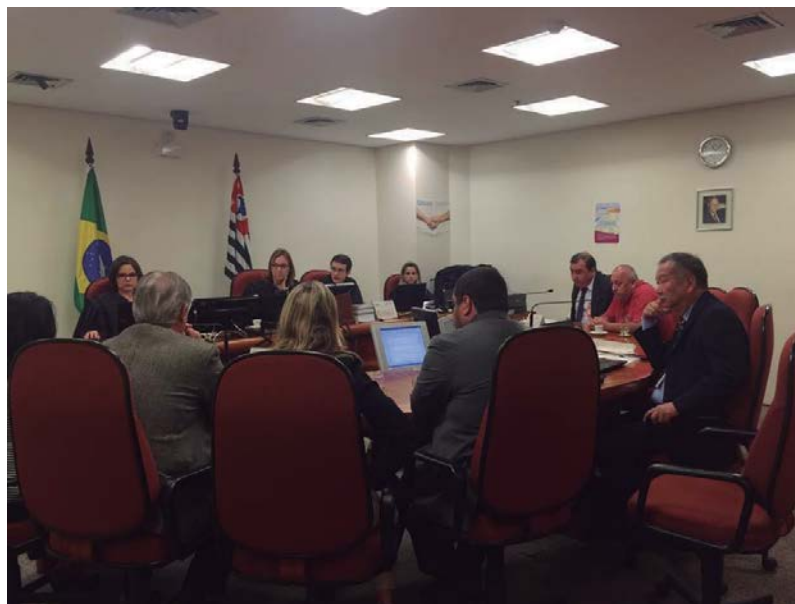
Primeira Audiência de Conciliação no TRT de Campinas