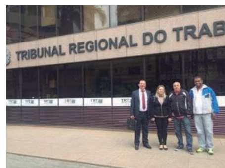
Audiência de Julgamento da Greve no TRT de Campinas