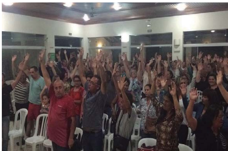
Assembleia para Deliberação da primeira Greve dos Servidores Municipais de Guaratinguetá