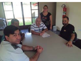
Reunião para selar a parceria entre Sindicato e a Colônia de Férias Sisnaturcard